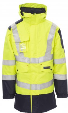
GIALLO FLUO/BLU NAVY 01014